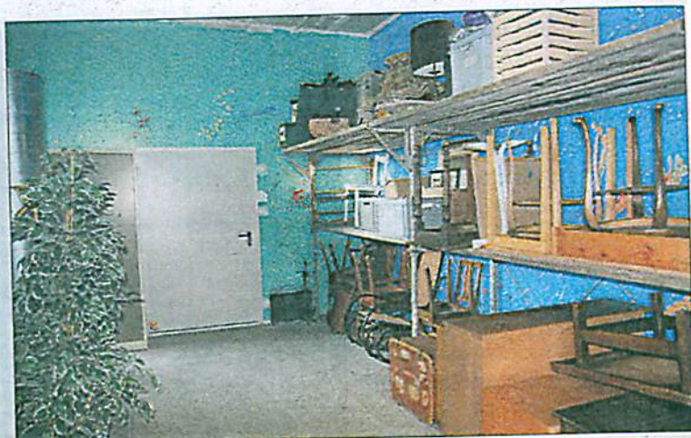
Blick in den neuen Requisiten- und Möbelfundus.