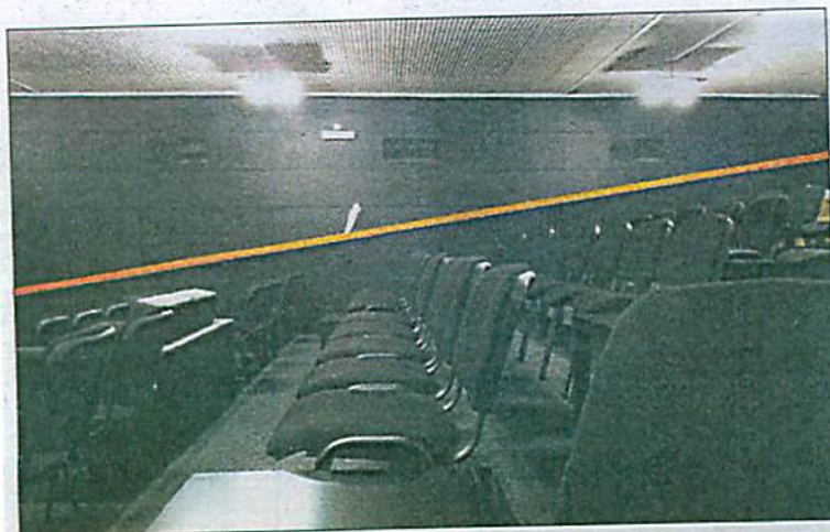
Blick auf die neue Saalbestuhlung mit insgesamt 100 Sitzplätzen.